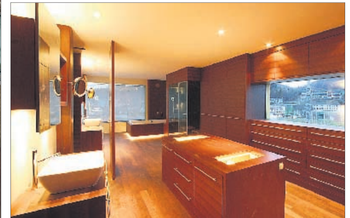
LUXUS PUR Auch das Bade- und Ankleidezimmer lässt keine Wünsche offen.