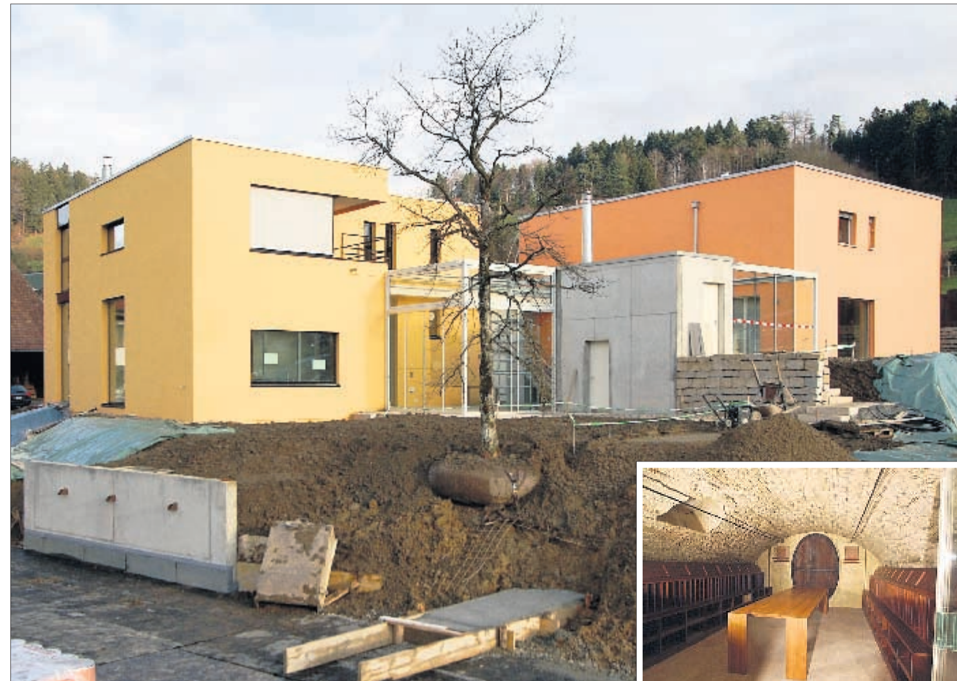
ARCHITEKTURJUWEL Die ersten beiden Neubauten der «Vision Quellengarten» stehen auf einem über 200 Jahre alten Gewölbekeller. »

Schauen Sie vorbeil Besucherparkplätze sind im Dorfzentrum signalisiert.